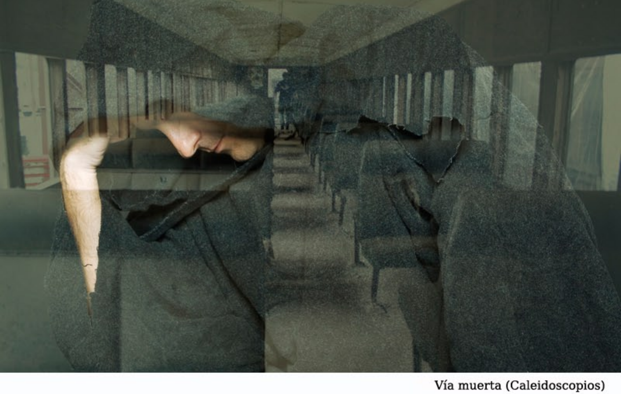
Vía muerta (Caleidoscopios)

Así, su Caleidoscopios surge desde esos cristallitos a través de los que cada uno puede ver lo quiera.